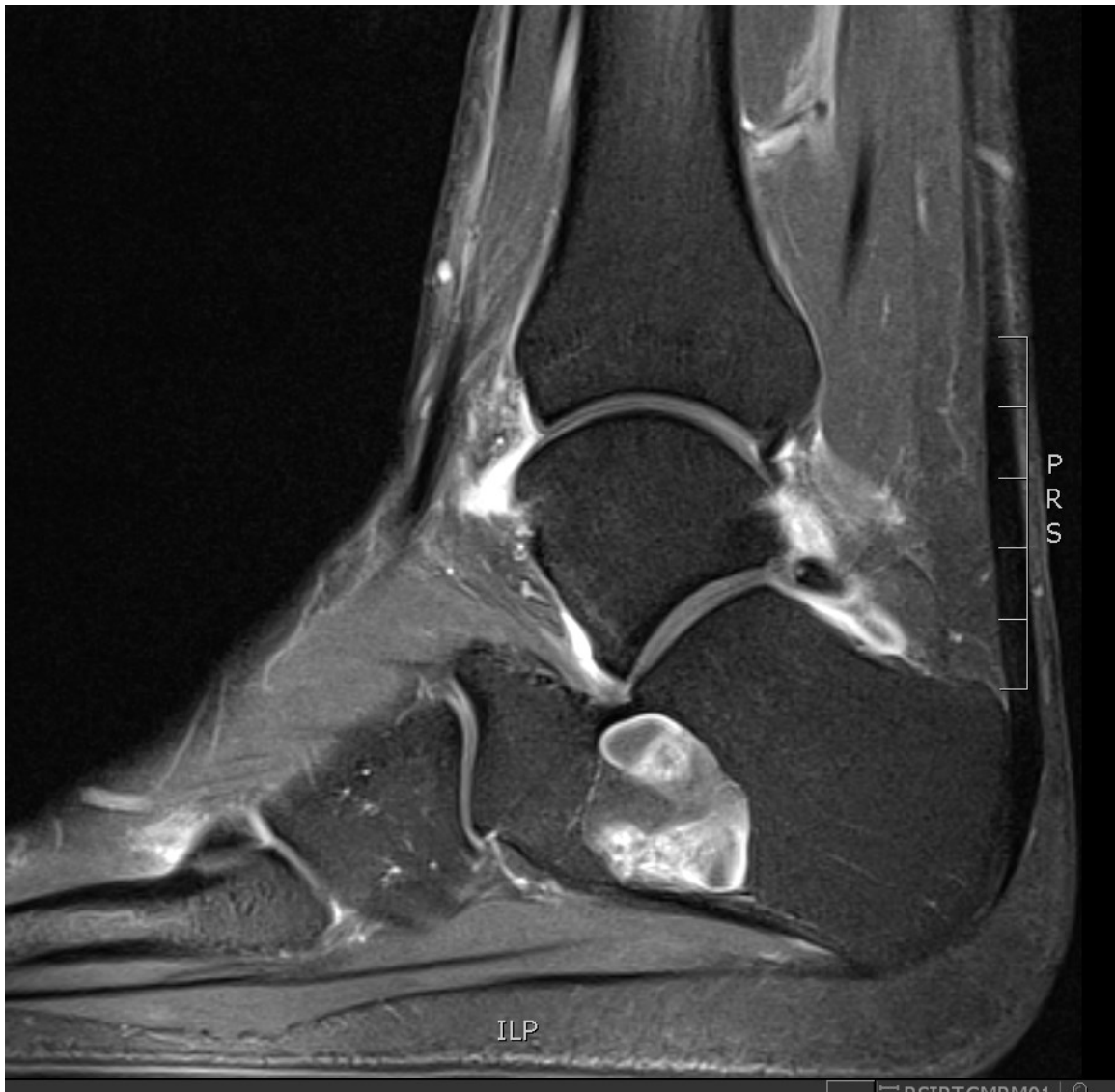
T1FS + Gadolinium